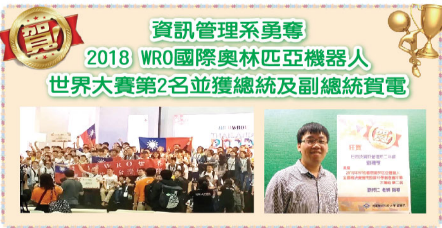
資訊管理系勇奪2018 WRO國際奧林匹亞機器人世界大賽第2名並獲總統及副總統賀電