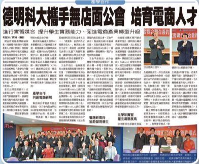
德明科大攜手無店面公會 培育電商人才

配合教育部產學鏈結政策，因應電子商務時代電商產業人才缺口問題，本校與中華民國無店面零售商業同業公會合作，進行「產學合作暨實習媒合」簽約，希望透過產官學合作，提升學生實務能力、促進電商產業轉型升級，培育現代社會所需之電商人才。