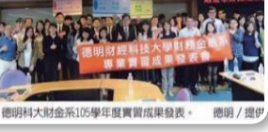
德明科大105學年度實習雇主滿意度調查結果發表，獲得實習單位肯定。

【台北訊】做為全國唯一以「財經」為專門領域的科技大學，德明科大致力培養學生專業知識與實務技能，自105學年度推動「全學年學生校外實習」課程。對於本校實習生的優良表現，實習單位皆給予高度評價，並希望實習生能持續留在企業，畢業後轉升正職，充分體現本校與職場無縫接軌的實習成效。本校105學年度實習雇主滿意度調查，實習雇主89.5%對於實習課程的整體效益感到滿意；91.1%對於實習學生整體表現感到滿意；未來繼續任用本校學生實習或就業的比例高達85.8%。實習單位普遍給予極高評價與肯定，顯示本校「將實習課程結合系科發展及專業核心能力，讓學生就學與就業無縫接軌，以提升就業競爭力」之推動目標，已達成顯著成效！