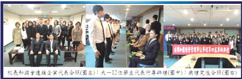
校長和與會連鎖企業代表合照(圖左)；大一-12位學生代表行尊師禮(圖中)；典禮完後合照(圖右)

「尊師禮」則為連鎖學程特色『企業實習五步曲（尊師禮、企業簡介、實習媒合、職場實習與成果發表）』的首部曲，由學生向師傅行禮，以示傳承，典禮莊嚴隆重。