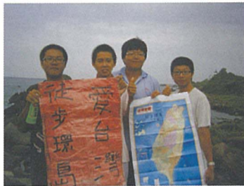
到達終點時興奮的合照