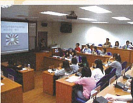
100(1)教學助理 TA 期初研習會座無虛席

除了教學助理(TA)協助教師教學工作以及輔導學生課後學習外，教學資源中心更建置有多元化的學習資源，如教學設備、數位教材製作軟體、教師成長研習工作坊、業界教師協同教學.....等，提供全校師生妥善運用，目前更積極建置行動學習(Mobile-learning)環境，將雲端智慧引進校內，讓師生在不受時間及空間的限制下進行學習活動，提高學習的效益。