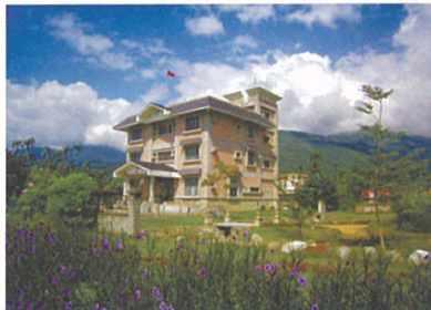
被票選為全台第二漂亮的大富派出所