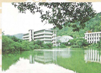
德明夢湖 (填平以後蓋了中正樓夜間部，曾舉辦多次的夢湖文學獎)