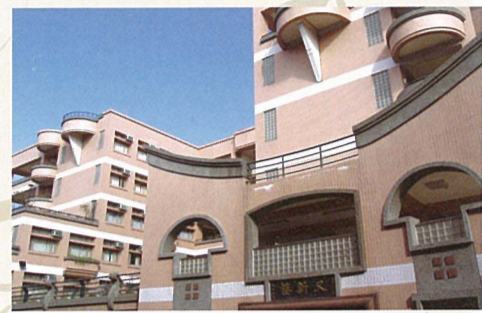
今日設備新穎的又新樓