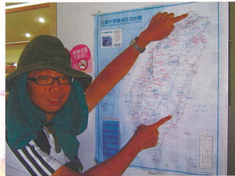
在關山的時候曬得最黑