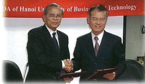
大學黎克朵副校長率團訪問本校