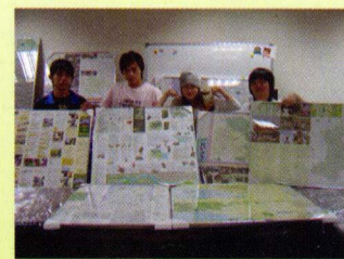
▲部份精彩國外綠色生活地圖摺頁成品