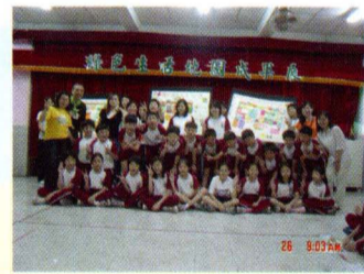
▲麗山國小綠色生活地圖推廣實況

未來，德明綠活圖不單只是摺頁製作，更希望透過活動的參與啟發學員對所處環境的重視，進一步對環境教育及鄉土人文關懷盡一份心力。