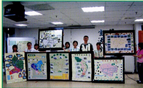
▲ 我們的驕傲內湖區基本圖——綠活圖種子培訓