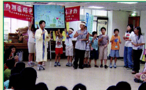
▲ 和樂一家親——名偵探柯南營

「綠活圖成果發表會」也緊鑼密鼓地進行著。雖然老天爺跟我們開了一個小玩笑，原計畫93.9.12的活動，因豪雨不斷的天候而改至93.9.26舉行，也因為有更充裕的時間相對地也讓我們做了更完善的準備，可能是被我們熱情所感召，93名學員實際參與，融化了之前準備工作的繁重感與不安。本次的成果發表會不僅詳細介紹了國內外整個綠活圖的運作，也清楚點出內湖寶貴的三十個綠色景點，下午安排一趟「內湖山脊線步道登山」綠色景點探訪，讓參與此次活動的夥伴們，