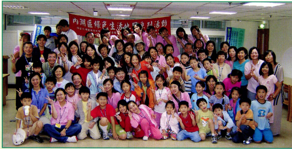
▲ 快樂出航——綠活圖成果發表會

所謂「好康大俗報」、「好東西要與好朋友分享」的心情下，第二梯段「綠活圖-名偵探柯南營」短短兩天內即召集鄰近社區大大小小的85名好朋友共同參與，雖說僅是乙日的活動，但由「成人組」及六組「幼童組」精彩成果演出，即可表達出這些好朋友對「綠活圖」認識、理解，從問卷回饋中更可感受學員對內湖熟悉度的提升及對本校活動高度的認同，甚至一些好友更建議這麼好的