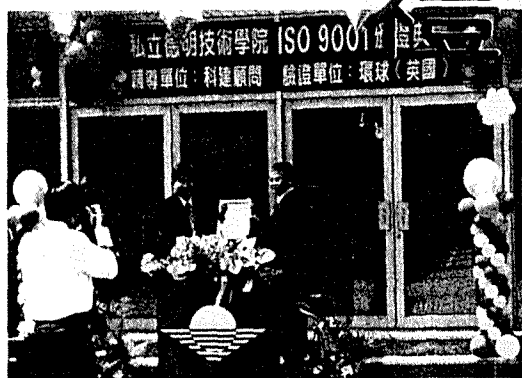
私立德明技術學院 ISO 9001 頒證典禮

三月二十日是本... 校通過ISO9001國... 際認證的頒證典... 禮，這是本校行政... 團隊過去一年共同... 努力所得到的成... 果，在此，我要向... 所有參與ISO工作... 的同仁致上最高的... 敬意！