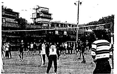
第二屆/中興(日) 第三名/北商 很感謝第廿七屆財稅學會學長姊的主辦，第廿八屆財稅學會協辦，以及師長、學