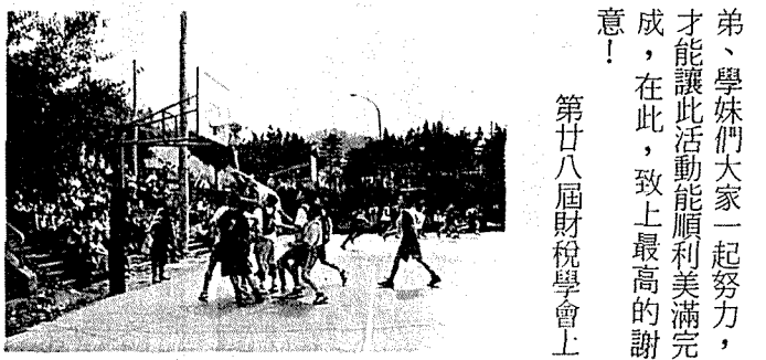
弟、學妹們大家一起努力，才能讓此活動能順利美滿完成，在此，致上最高的謝意！ 第廿八屆財稅學會上