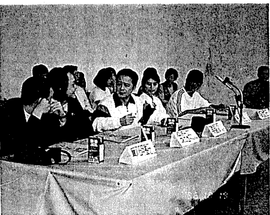
評審老師評審實況