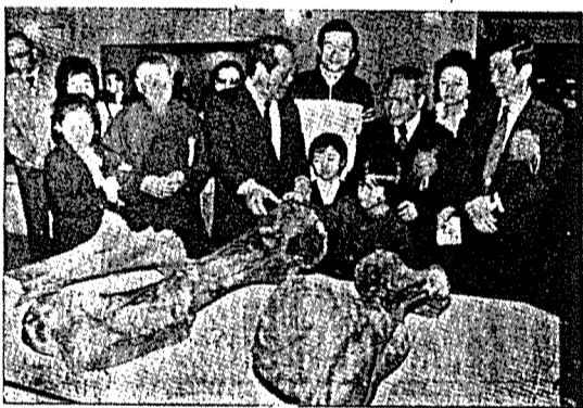
鄭公應台南市長蘇南成之參觀恐龍展

現在我們革命先烈所締造的中華民國，雖然遭到國際共產黨徒的破壞，但政府退守台、澎、金、馬復興基地以來勵精圖治，實行三民主義的建設，民生均富，政治清明，已成為海外中國人希望的燈塔。語云「得民者昌，失民者亡」。台灣復興基地的繁榮康樂與中國大陸的貧窮落後，成為尖銳的對比，經為舉世所公認。今後如何在蔣總統經國先生英明領導下，完成以三民主義統一中國的使命，正是這一代青年的重責大任。在慶祝青年節的今天，彥彥盼望青年朋友們要隨時充實自己的學問，培養處事的能力，尤其人人要加強對國家、對社會的責任感，學習革命先烈的革命救國精神，同心協力，共為拯救億萬同胞的幸福，為建設富強的新中國而奮鬥！為中國青年革命救國史重寫光輝燦爛的新頁。