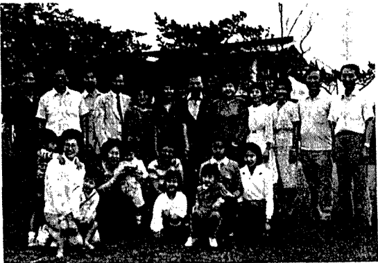
合影前廳生懷心中動活年青山金在屬眷及事董陳長校陳

【本刊訊】本校榮獲全國專校英語演講及英語辯論比賽雙料冠軍，消息傳來，全體師生雀躍不已，內湖區區長並特別向本校師生道賀。