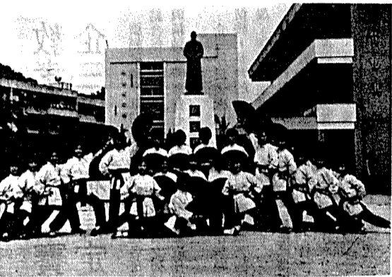
(年少出雄英)甲三銀一之目節演藝才