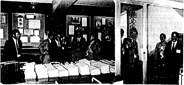
蒞校參觀國父思想教學 評鑑委員蒞校參觀

（本刊訊）北區大專院校 國父思想教學座談活動，定於八月八日上午在本校舉行，並展開各項參觀活動。將有各校六十位 國父思想教學召集人參加。 此項活動係為觀摩 國父思想教學，集思廣益，落實思想教育成果而舉辦。 活動由本校校長陳光憲主持。上午十時，先在本校 國父思想教室聽取有關本校教學簡報，舉行座談會。然後，所有參加人員於下午一時四十分，前往木柵國防部青島幹部訓練班資料中心及杭州南路電信局查號台參觀。