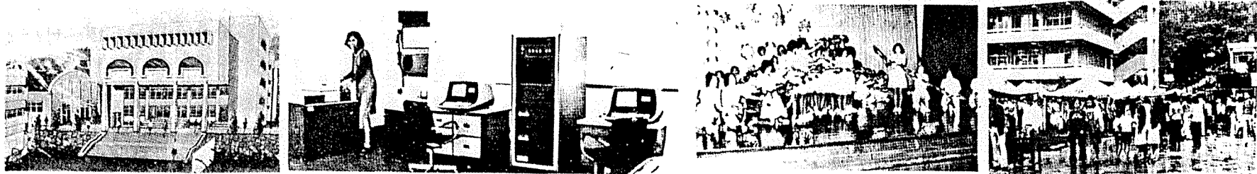
4. 新建築學生生活中心

本校教育，旨在培育現代化之商業專才，發展國家經濟建設之政策，並遵照 蔣總統經國先生訓示「更著重反共愛國教育、品德教育、能知能行的教育」提高教育效果，以應國家經濟建設之需要，完成現代化建設之目標，自建校以來，由於全校師生之共同努力與全體同仁之稱讚合作，校務工作尚能順利進行，惟教育乃百年大計，本校校務仍諸多有待繼續改進與大力推廣者，以培育商業專才，造福國家社會。