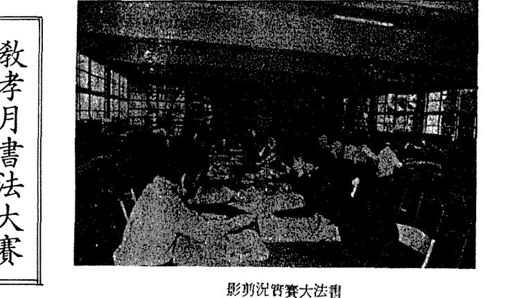
影剪況賽書大法書