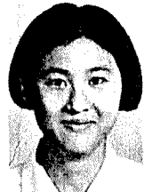
芳 維 賴