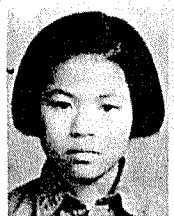
情 瑞 張