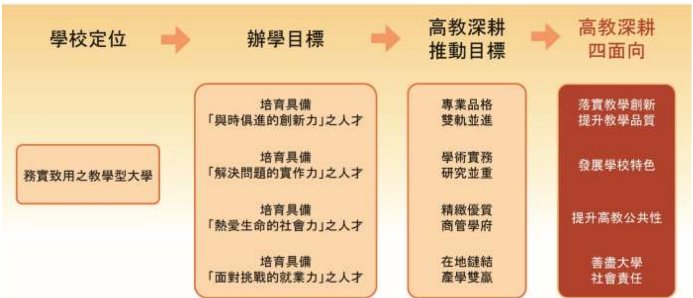
圖 1-1-1 本校中程校務計畫與高教深耕計畫之連結

本校之辦學目標為在「務實致用之教學型大學」定位下培育具備「與時俱進的創新力」、「解決問題的實作力」、「熱愛生命的社會力」及「面對挑戰的就業力」之人才。為落實高教深耕計畫與本校中程校務計畫之緊密連結，分別推展出本校高教深耕計畫執行之四大目標，並在此四大目標下，預先勾勒出各目標下之重點推動項目。而後，再分別對應至教育部揭鑿之高教深耕計畫四大面向，並分別設定各項子目標暨執行方案。相關連結綜整如下圖 1-1-1。