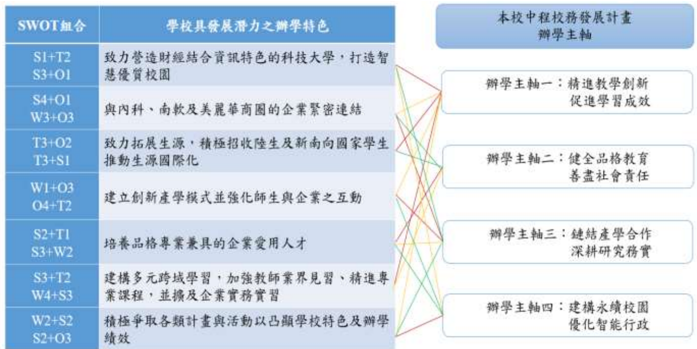
圖 1-1-2 本校 SWOT 分析與中程校務發展計畫組合

依上述 SWOT 分析之結果，分別以學校內部的優勢與劣勢與外部環境的機會與威脅進行可能的策略組合，訂定學校具發展潛力之辦學特色「專業為重、品格優先」和「在地鏈結、產業雙贏」，並與本校校務中程發展計畫中各辦學主軸之發展策略及行動方案相連結，以期落實發展目標，如圖 1-1-2 本校 SWOT 分析與中程校務發展計畫組合。