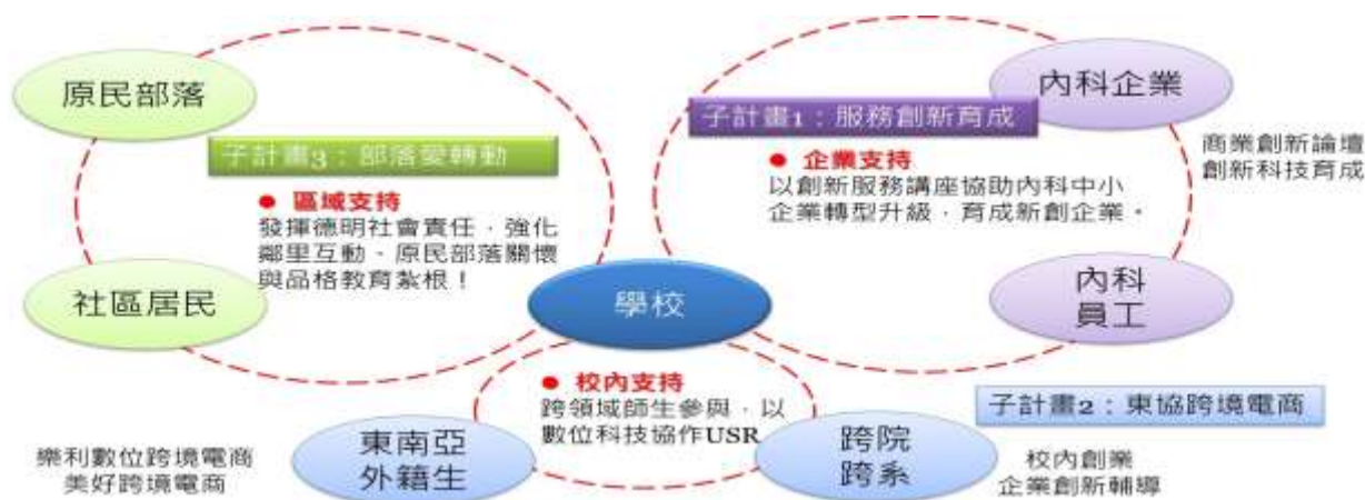
圖 1：以數位科技支援多元族群 USR Hub 計畫架構

本計畫以「數位科技支援多元族群 USR Hub (校園協作生態系統)」為重點，緊扣本校中程發展計畫與教育部高教深耕計畫的推動，有助於校務發展目標之規劃與核心理念的落實。實施場域對象涵蓋多元族群，包括內湖科技園區企業、部落區民和本校外籍生，校內整合跨院系師生資源，透過數位科技協助多元族群發展，善盡大學社會責任。計畫實質內涵符合辦學主軸（落實教學創新、精進學習成效；健全品格教育、善盡大學社會責任；強化產研實習、推動國際交流），並結合校務發展目標之產業需求和加強產學鏈結。實現「培育打造永續社會人才之卓越科技大學」的學校願景。